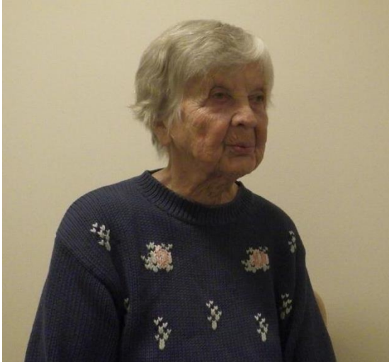
Pilt 2. Torutatud huultega hingamine