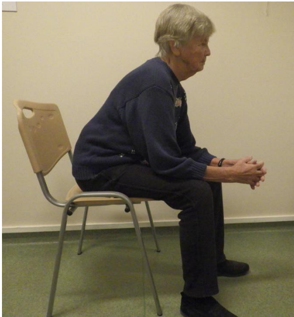
Pilt 3. Lõdvestumist soodustav kehaasend