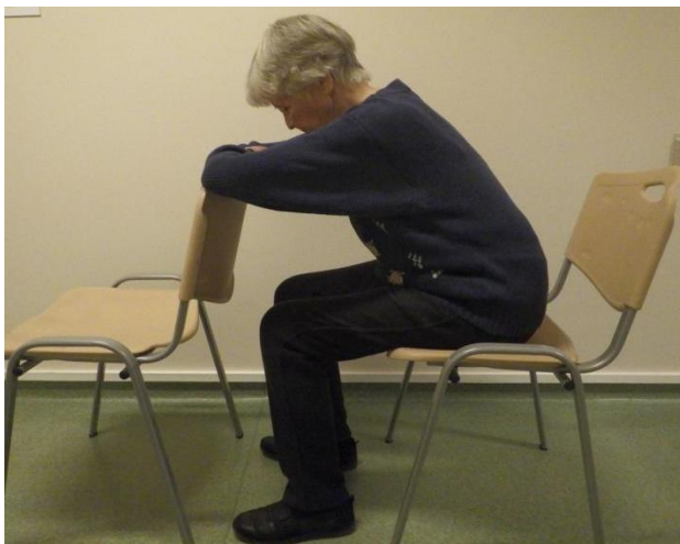
Pilt 4. Lõdvestumist soodustav kehaasend