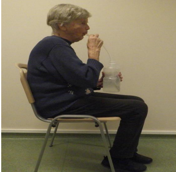
Pilt 5. PEP-pudeli kasutamine