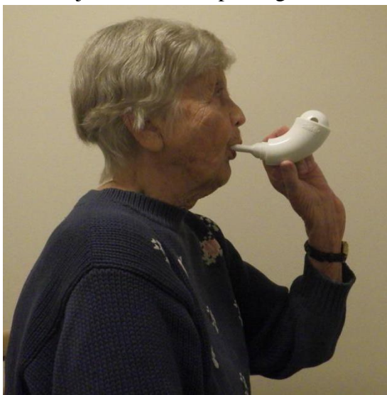
Pilt 6. Abivahend Shaker

Istu mugavalt, selg sirge; võta abivahend kätte ja aseta huulik horisontaalselt suule; jälgi, et huulik oleks hammaste vahel ja suru huuled ümber selle; hinga aeglaselt ja läbi nina sügavalt sisse; hoiu hinge kinni 1-2 sekundit; hinga aeglaselt, sügavalt ja nii pikalt kui suudad läbi suu välja abivahendisse; välja hingates pinguta ka põselihased; korda sisse- ja väljahingamist 10-15 korda (Pilt 6 ja 7 ). NB! Aseta käsi rindkerele ja tunnetada vibratsiooni. Vibratsiooni tugevus sõltub abivahendi asetusest, leia endale sobivaim asend! Ära üle pinguta, sest nii väsitad ennast veelgi rohkem ja võib tekkida pearinglus.