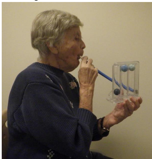
Pilt 7. Hingamislihaste treening (Triflo)

NB! Aparaaati hoida püstises asendis! Jälgi hingamist, s.t ära hakka abivahendisse lõõtsutama, see väsitab ega ole efektiivne.