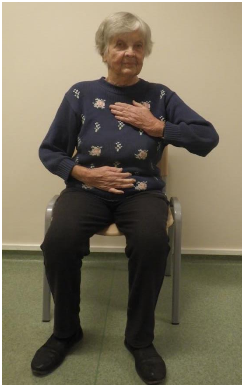
Pilt 1 Diafragma ehk vahelihase abil hingamine

NB! Harjuta seda tehnikat nii kaua, kuni see saab harjumuseks!